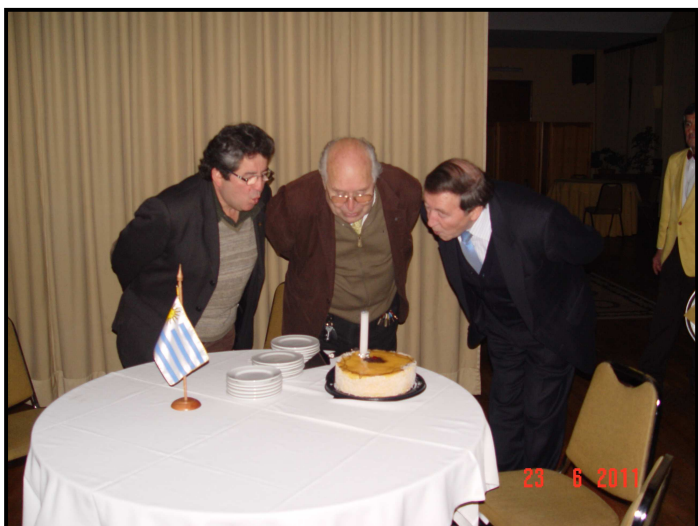
Los "Cumpleaños" del mes